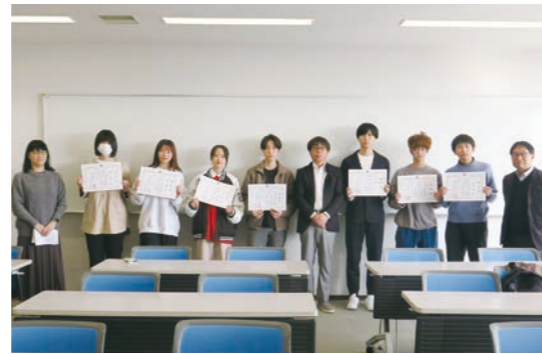
2023年度簿記検定チャレンジ模試表彰式

簿記検定チャレンジ模試参加者全員に、参加賞と大原簿記専門学校の受講料割引券を渡しています。